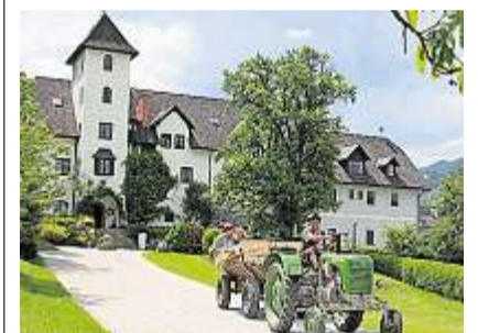
Eine Traktorfahrt ins Grüne erwartet Verliebte in Schladming.