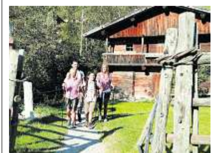
Familien genießen den Sommer in der Wildschönau extra günstig.